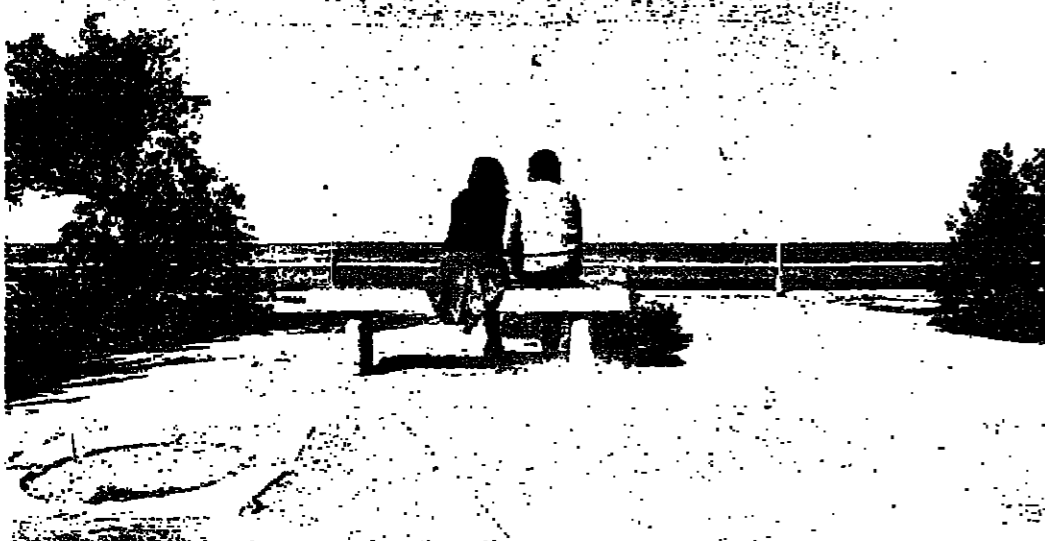
رحلة حلم فوق الدواج